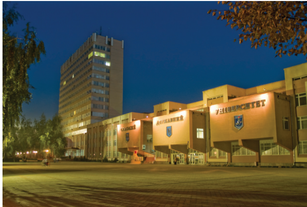
Evening panorama of SSU