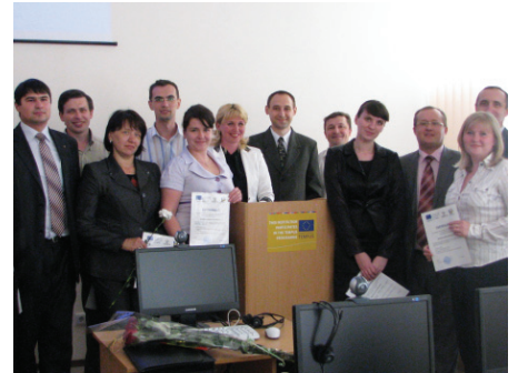
Participants of TEMPUS project

Ministry of Education and Science of Germany published two mostly successful projects of TEMPUS Programme executed by the German higher education institutions in the period of 2006-2010, among which there was a project with partnership of SSU participated.