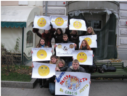
Europe Days in Sumy

The University constantly conducts research in this sphere. PhD thesis