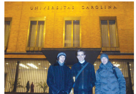
Representatives of SSU in Prague, Czech Republic