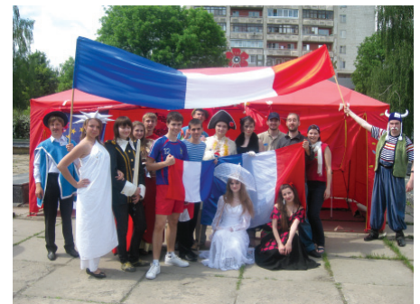
Europe Days in Sumy

Annually in May the University celebrates the Europe Days. Thus, last year students and lecturers participated in establishment of European campus on Teatralnaya Square in Sumy (live sculptures, competitions, theatricalized knights' tournaments, quizzes); carried out the University film festival of European